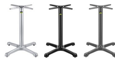
EP (Extra Protection)